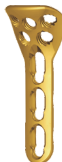
Płytki do szyjki kości promieniowej (x-04-209-L)